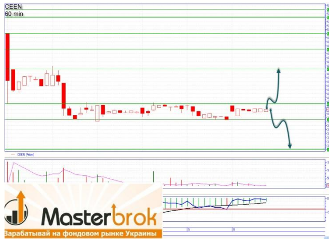
CEEN зажат в боковом канале

«Алчевка» сформировала узкий диапазон торговли, поддержка 0,0438грн., сопротивление 0,0460-0,0465грн. При пробитии уровня 0,0465грн. в объеме, можно говорить о «бычьем» развитии событий с основной целью наверху 0,051грн. диагональное сопротивление и промежуточной 0,0482-0,0485грн. «Медвежье» движение можно начинать с достижения цены 0,0430-0,0432грн., основная цель вниз 0,0415-0,0417грн.