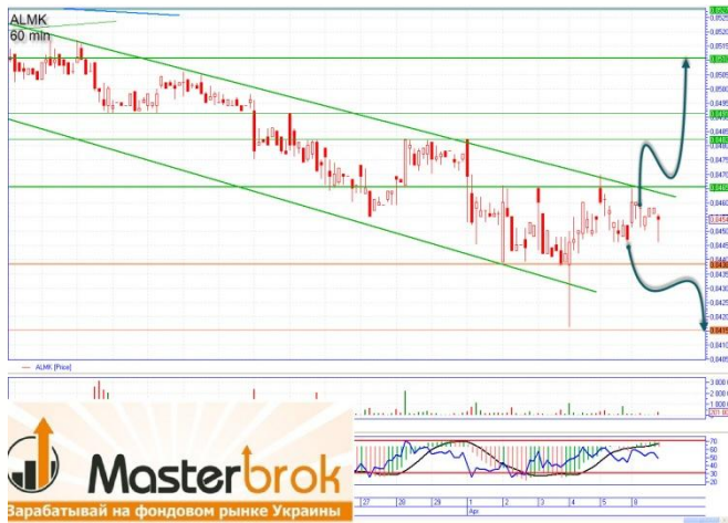
ALMK на поддержке 0,0455

«Алчевка» сформировала узкий диапазон торговли, поддержка 0,0438грн., сопротивление 0,0460-0,0465грн. При пробитии уровня 0,0465грн. в объеме, можно говорить о «бычьем» развитии событий с основной целью наверху 0,051грн. диагональное сопротивление и промежуточной 0,0482-0,0485грн. «Медвежье» движение можно начинать с достижения цены 0,0430-0,0432грн., основная цель вниз 0,0415-0,0417грн.