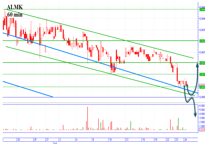
ALMK увеличила убыток

«Мотор» пробил хорошую горизонтальную поддержку 1835-1845грн. и цена опустилась ниже, продолжая движение в нисходящем канале с диапазоном 1750-1843грн. «Бычий» сценарий начинаем с цены 1860грн., основная краткосрочная цель наверху 1905-1910грн. А также можно пробовать заходить, после достижения диагональной поддержки в области 1760-1765грн и отскока наверх с целью 1845 грн. «Медвежий» сценарий, реализуем с достижения диагонального сопротивления 1840-1845грн. и отскока вниз, можно заходить с цены 1830-1835грн., основная цель внизу 1755грн. диагональная она же и горизонтальная поддержка (25.10.12г.)