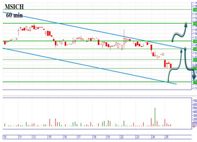
MSICH три сценария

«Мотор» пробил хорошую горизонтальную поддержку 1835-1845грн. и цена опустилась ниже, продолжая движение в нисходящем канале с диапазоном 1750-1843грн. «Бычий» сценарий начинаем с цены 1860грн., основная краткосрочная цель наверху 1905-1910грн. А также можно пробовать заходить, после достижения диагональной поддержки в области 1760-1765грн и отскока наверх с целью 1845 грн. «Медвежий» сценарий, реализуем с достижения диагонального сопротивления 1840-1845грн. и отскока вниз, можно заходить с цены 1830-1835грн., основная цель внизу 1755грн. диагональная она же и горизонтальная поддержка (25.10.12г.)