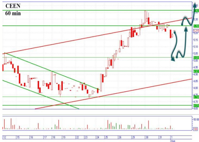
CEEN три сценария

Цена достигла трехмесячного максимума 5,36грн. и скорректировалась вниз к ближайшей поддержке 5,00-5,02грн. «Бычий» сценарий, можно начинать с цены 5,25грн. с основной целью наверху 5,70-5,73грн., горизонтальное сопротивление. А так же есть еще один вариант, такого сценария, после снижения цены на поддержку 5,00-5,02грн., в момент отскока входить с целью наверху 5,25-5,30грн. «Медвежий» сценарий, реализуем с текущих уровней 5,18-5,20грн., основная цель вниз 4,95-5,00грн., горизонтальная хорошая поддержка.