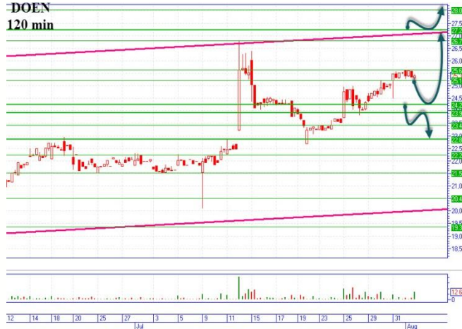
DOEN на пути к 27.00 и выше

Цена достигла трехмесячного максимума 5,36грн. и скорректировалась вниз к ближайшей поддержке 5,00-5,02грн. «Бычий» сценарий, можно начинать с цены 5,25грн. с основной целью наверху 5,70-5,73грн., горизонтальное сопротивление. А так же есть еще один вариант, такого сценария, после снижения цены на поддержку 5,00-5,02грн., в момент отскока входить с целью наверху 5,25-5,30грн. «Медвежий» сценарий, реализуем с текущих уровней 5,18-5,20грн., основная цель вниз 4,95-5,00грн., горизонтальная хорошая поддержка.