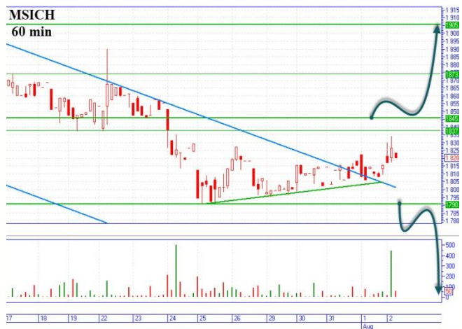
MSICH пробой трендовой линии

Цена «мотора» пробилa сопротивления нисходящего канала на уровне 1795-1800грн. и пока находится в боковом движении с диапазоном 1800-1840грн. «Бычий» сценарий начинаем с цены 1845грн. с целью наверху 1905грн. горизонтальное сопротивление. «Медвежье» сценарий, начинаем после пробития горизонтальной поддержки цены 1790грн., цель промежуточная вниз поддержка 1740грн., основная 1620грн. сильная поддержка.