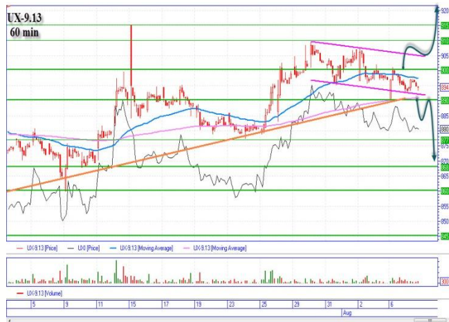
UX-9.13 под психологическим уровнем 900

«Аваль» после хорошего рывка наверх на 0,1050грн. , снизился на поддержку 0,1000-0,101грн. «Медвежий» сценарий, цена захода 0,0990грн., основная цель вниз 0,0950грн. горизонтальная поддержка, промежуточная 0,0970грн. «Бычий» сценарий, после отскока наверх от поддержки 0,10 с пробитием локальной линии диагонального сопротивления на уровне 0,1015-0,1020грн. (обязательно должны быть объемы). Цель наверху 0,1050грн. горизонтальное сопротивление.