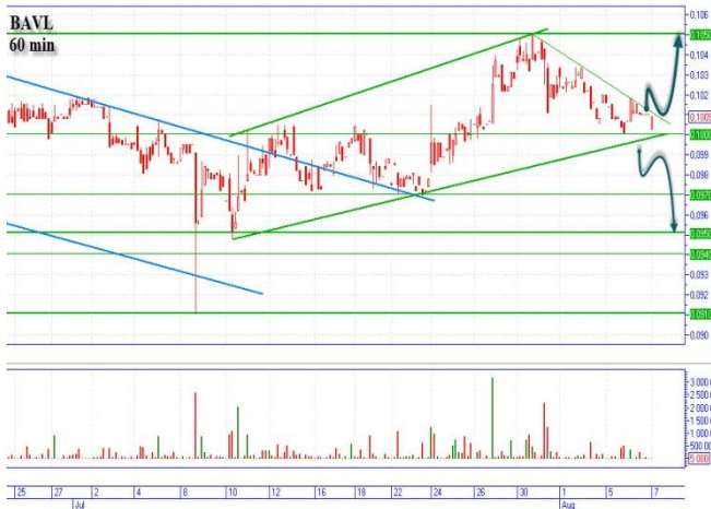
BAVL отскок от 0,1000

«Аваль» после хорошего рывка наверх на 0,1050грн. , снизился на поддержку 0,1000-0,101грн. «Медвежий» сценарий, цена захода 0,0990грн., основная цель вниз 0,0950грн. горизонтальная поддержка, промежуточная 0,0970грн. «Бычий» сценарий, после отскока наверх от поддержки 0,10 с пробитием локальной линии диагонального сопротивления на уровне 0,1015-0,1020грн. (обязательно должны быть объемы). Цель наверху 0,1050грн. горизонтальное сопротивление.