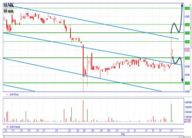
ALMK реакция на новости

«Алчевка» сегодня подросла к горизонтальной поддержке 0,0410-0,0412грн., после выхода позитивных для нее новостей. Цена может вернуться в диапазон 0,042-0,044грн. «Медвежий» сценарий, пробоем реализовывать после прохождения цены 0,040грн., цель внизу 0,0385грн., ближайшие минимумы. «Бычий» сценарий начинаем реализовывать с цены 0,0412-0,0415грн., после пробития горизонтального сопротивления с объемами, основная цель наверху 0,044грн., промежуточная остановка 0,0425грн.