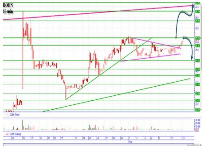
DOEN на подходе к 25.55

«Алчевка» сегодня подросла к горизонтальной поддержке 0,0410-0,0412грн., после выхода позитивных для нее новостей. Цена может вернуться в диапазон 0,042-0,044грн. «Медвежий» сценарий, пробоем реализовывать после прохождения цены 0,040грн., цель внизу 0,0385грн., ближайшие минимумы. «Бычий» сценарий начинаем реализовывать с цены 0,0412-0,0415грн., после пробития горизонтального сопротивления с объемами, основная цель наверху 0,044грн., промежуточная остановка 0,0425грн.