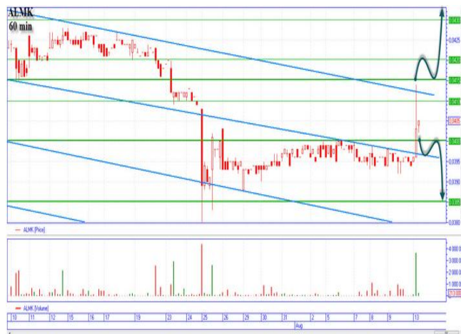
ALMK реакция на новости

«Алчевка» сегодня подросла к горизонтальной поддержке 0,0410-0,0412грн., после выхода позитивных для нее новостей. Цена может вернуться в диапазон 0,042-0,044грн. «Медвежий» сценарий, пробьем реализовывать после прохождения цены 0,040грн., цель внизу 0,0385грн., ближайшие минимумы. «Бычий» сценарий начинаем реализовывать с цены 0,0412-0,0415грн., после пробития горизонтального сопротивления с объемами, основная цель наверху 0,044грн., промежуточная остановка 0,0425грн.