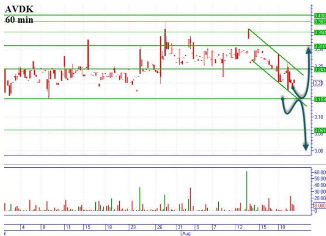
AVDK пробила уровень 3.24

Цена пробила поддержку 3,24грн. и устремилась вниз, тем самым сформировав нисходящий локальный канал с поддержкой на 3,15грн. и сопротивлением 3,24грн. Пробоитие поддержки даст возможность открыть «медвежий» позицию с цены 3,13грн. с основной целью вниз 2,97-3,01грн. горизонтальная поддержка. При остановке на поддержке 3,15грн. и отскоке вверх, можно пробовать открыться в «бычьем» направлении, промежуточная цель наверху 3,24грн., основная 3,30-3,34грн.