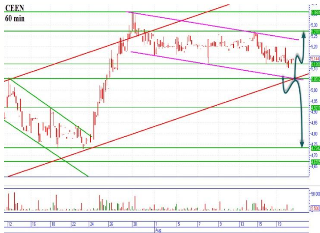
CEEN коррекция на восходящем тренде

Цена пробила поддержку 3,24грн. и устремилась вниз, тем самым сформировав нисходящий локальный канал с поддержкой на 3,15грн. и сопротивлением 3,24грн. Пробоитие поддержки даст возможность открыть «медвежий» позицию с цены 3,13грн. с основной целью вниз 2,97-3,01грн. горизонтальная поддержка. При остановке на поддержке 3,15грн. и отскоке вверх, можно пробовать открыться в «бычьем» направлении, промежуточная цель наверху 3,24грн., основная 3,30-3,34грн.