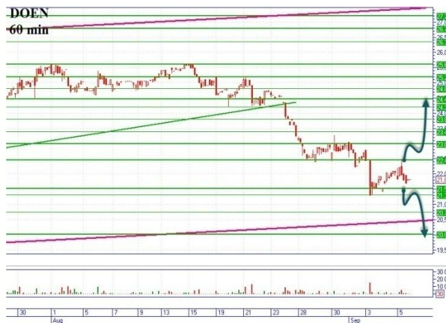
DOEN на пути к долгосрочной поддержке

Пока движение цены идет в узком коридоре, поддержка 0,1268-0,1272грн., сопротивление 0,1310-0,1315грн. Прорыв сопротивления, будет означать «бычий» сценарий с основной целью наверху 0,1392-0,1395грн. В случае прохождения поддержки, можем говорить о развитии «медвежьего» сценария, цель внизу 0,1155грн. (минимум 13.06.13г.), промежуточная остановка горизонтальная поддержка 0,1215-0,1218грн.