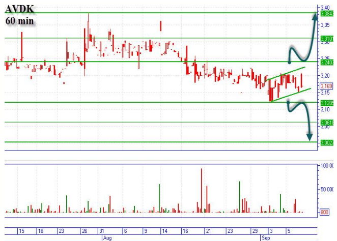
AVDK в узком канале

Пока движение цены идет в узком коридоре, поддержка 0,1268-0,1272грн., сопротивление 0,1310-0,1315грн. Прорыв сопротивления, будет означать «бычий» сценарий с основной целью наверху 0,1392-0,1395грн. В случае прохождения поддержки, можем говорить о развитии «медвежьего» сценария, цель внизу 0,1155грн. (минимум 13.06.13г.), промежуточная остановка горизонтальная поддержка 0,1215-0,1218грн.