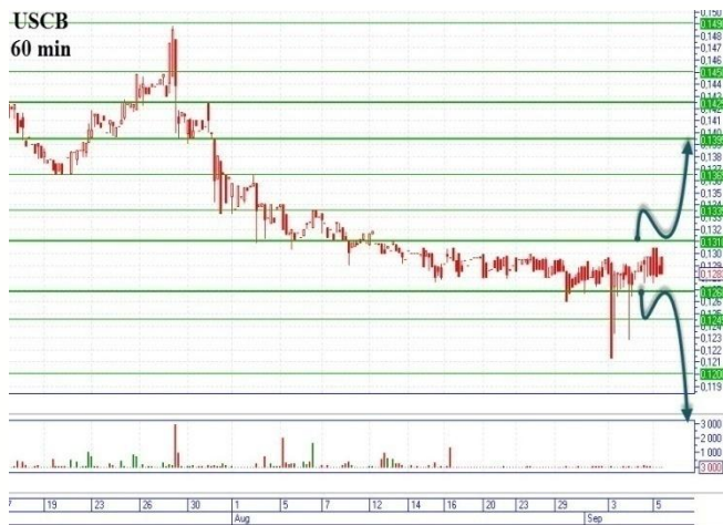
USCB в узком канале

Пока движение цены идет в узком коридоре, поддержка 0,1268-0,1272грн., сопротивление 0,1310-0,1315грн. Прорыв сопротивления, будет означать «бычий» сценарий с основной целью наверху 0,1392-0,1395грн. В случае прохождения поддержки, можем говорить о развитии «медвежьего» сценария, цель внизу 0,1155грн. (минимум 13.06.13г.), промежуточная остановка горизонтальная поддержка 0,1215-0,1218грн.