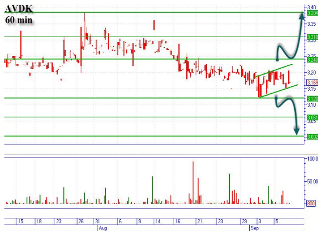
AVDK в узком канале

Пока движение цены идет в узком коридоре, поддержка 0,1268-0,1272грн., сопротивление 0,1310-0,1315грн. Прорыв сопротивления, будет означать «бычий» сценарий с основной целью наверху 0,1392-0,1395грн. В случае прохождения поддержки, можем говорить о развитии «медвежьего» сценария, цель внизу 0,1155грн. (минимум 13.06.13г.), промежуточная остановка горизонтальная поддержка 0,1215-0,1218грн.