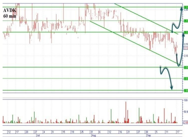
AVDK три сценария

Цена снижается на поддержку 0,0880грн., сформировался нисходящий канал с сопротивлением 0,0915грн. «Бычий» сценарий, начинаем в двух вариантах. Первый, после снижения на диагональную поддержку 0,0875-0,088грн., ждем отскок и пробуем открыть позицию наверх цель 0,0915грн. Второй, пробитие диагонального сопротивления в объемах и с цены 0,0917грн. открываемся наверх, цель 0,095грн. «Медвежий», сценарий начинаем с пробития диагональной поддержки 0,0875грн., с основной целью вниз 0,0805-0,081грн., горизонтальная поддержка.