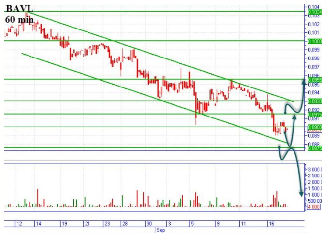
BAVL в нисходящем канале

Цена снижается на поддержку 0,0880грн., сформировался нисходящий канал с сопротивлением 0,0915грн. «Бычий» сценарий, начинаем в двух вариантах. Первый, после снижения на диагональную поддержку 0,0875-0,088грн., ждем отскок и пробуем открыть позицию наверх цель 0,0915грн. Второй, пробитие диагонального сопротивления в объемах и с цены 0,0917грн. открываемся наверх, цель 0,095грн. «Медвежий», сценарий начинаем с пробития диагональной поддержки 0,0875грн., с основной целью вниз 0,0805-0,081грн., горизонтальная поддержка.