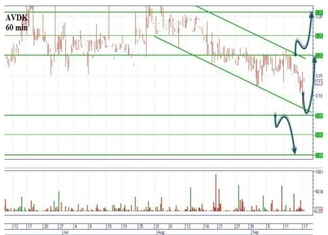
AVDK три сценария

Цена снижается на поддержку 0,0880грн., сформировался нисходящий канал с сопротивлением 0,0915грн. «Бычий» сценарий, начинаем в двух вариантах. Первый, после снижения на диагональную поддержку 0,0875-0,088грн., ждем отскок и пробуем открыть позицию наверх цель 0,0915грн. Второй, пробитие диагонального сопротивления в объемах и с цены 0,0917грн. открываемся наверх, цель 0,095грн. «Медвежий», сценарий начинаем с пробития диагональной поддержки 0,0875грн., с основной целью вниз 0,0805-0,081грн., горизонтальная поддержка.