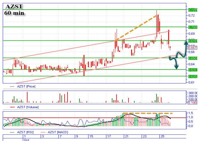
AZST падает на поддержку

Цена продолжает тестировать верхние границы, преодолев сопротивление на уровне 24,05-24,25грн. Для дальнейшего роста надо немного скорректироваться или хотя бы короткое время проторговать диагональную поддержку 24,05грн. Пробитие поддержки, может говорить об отработке «медвежьего» сценария, с целью на 22,9-23,0грн. Если же пробития поддержки не увидим, тогда ждем отскока после чего отработываем «бычий» сценарий, основная цель наверху 26,8грн., промежуточная 25,5-25,6грн.