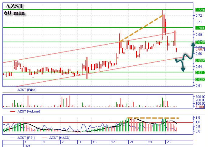
AZST падает на поддержку

Цена продолжает тестировать верхние границы, преодолев сопротивление на уровне 24,05-24,25грн. Для дальнейшего роста надо немного скорректироваться или хотя бы короткое время проторговать диагональную поддержку 24,05грн. Пробитие поддержки, может говорить об отработке «медвежьего» сценария, с целью на 22,9-23,0грн. Если же пробития поддержки не увидим, тогда ждем отскока после чего отработываем «бычий» сценарий, основная цель наверху 26,8грн., промежуточная 25,5-25,6грн.