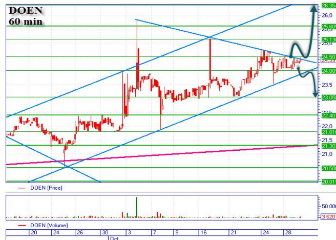
DOEN восходящий тренд

Цена продолжает тестировать верхние границы, преодолев сопротивление на уровне 24,05-24,25грн. Для дальнейшего роста надо немного скорректироваться или хотя бы короткое время проторговать диагональную поддержку 24,05грн. Пробитие поддержки, может говорить об отработке «медвежьего» сценария, с целью на 22,9-23,0грн. Если же пробития поддержки не увидим, тогда ждем отскока после чего отработываем «бычий» сценарий, основная цель наверху 26,8грн., промежуточная 25,5-25,6грн.