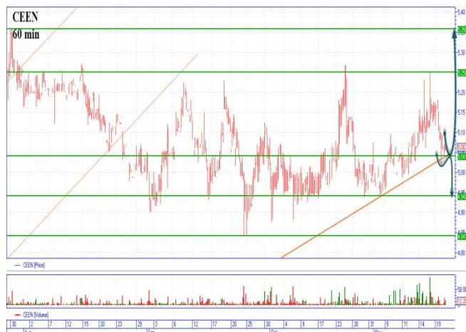
CEEN нашел диагональную поддержку

Цена «доена» подошла к горизонтальному сопротивлению 25,6грн., оттолкнувшись вниз на 25грн. при этом диагональная поддержка находится на 24,5грн., куда и может отскочить цена. Прорывая с закреплением сопротивление 25,6грн., следующий уровень сопротивления на 26,8грн., «бычий» сценарий. Прохождение диагональной поддержки 24,5грн., увидим снижение на основную цель 22,9грн. и временной остановкой на 23,9грн., «медвежий» сценарий.