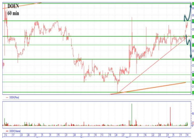
DOEN на пути обновления 4-месячного максимума

Цена «доена» подошла к горизонтальному сопротивлению 25,6грн., оттолкнувшись вниз на 25грн. при этом диагональная поддержка находится на 24,5грн., куда и может отскочить цена. Прорывая с закреплением сопротивление 25,6грн., следующий уровень сопротивления на 26,8грн., «бычий» сценарий. Прохождение диагональной поддержки 24,5грн., увидим снижение на основную цель 22,9грн. и временной остановкой на 23,9грн., «медвежий» сценарий.